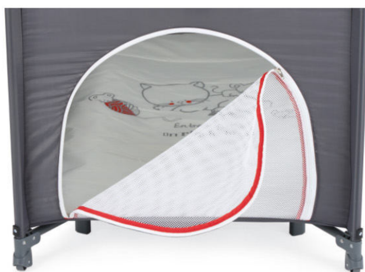
Porta em rede com fecho de correr Puerta en red con cremallera