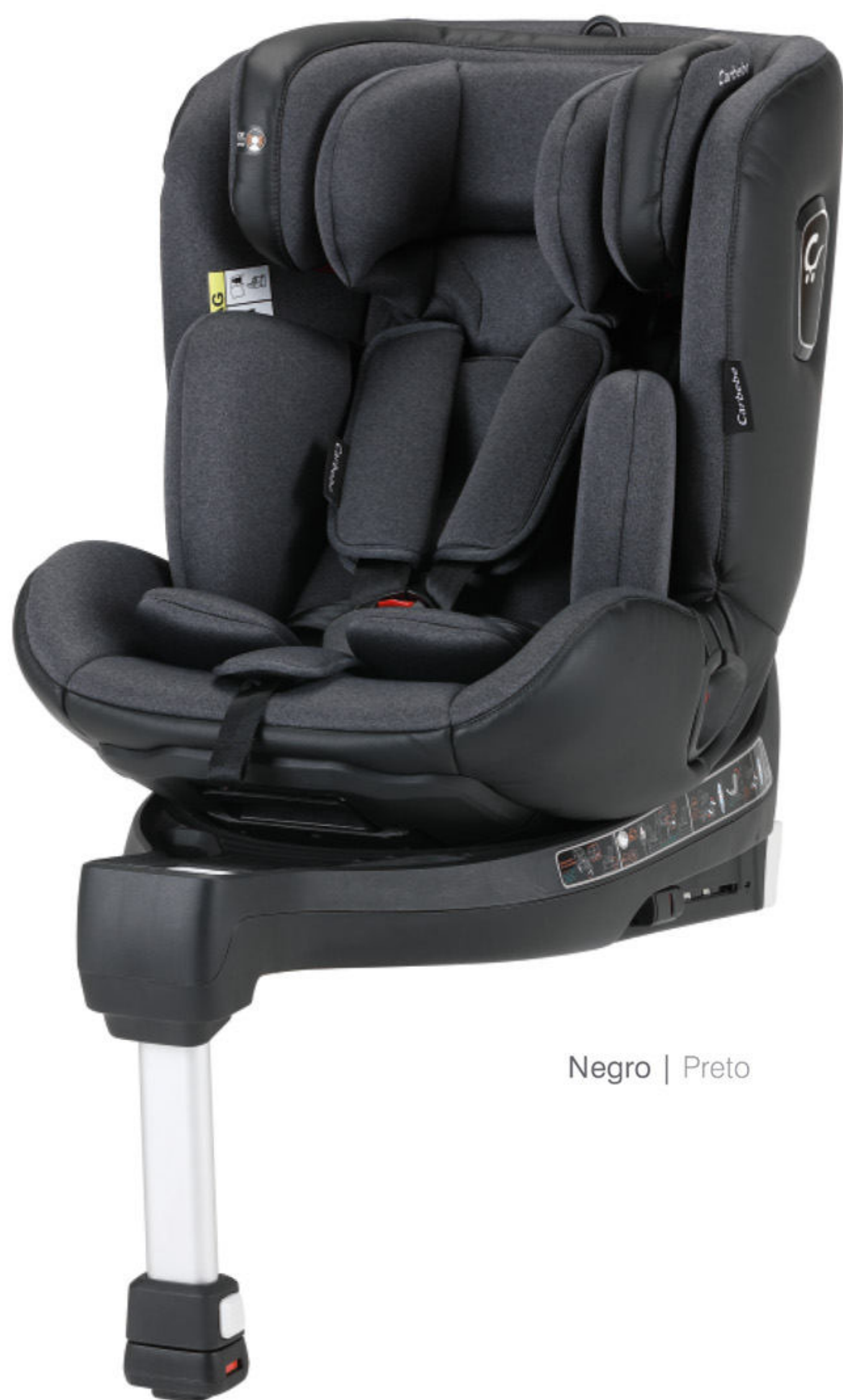
Negro | Preto