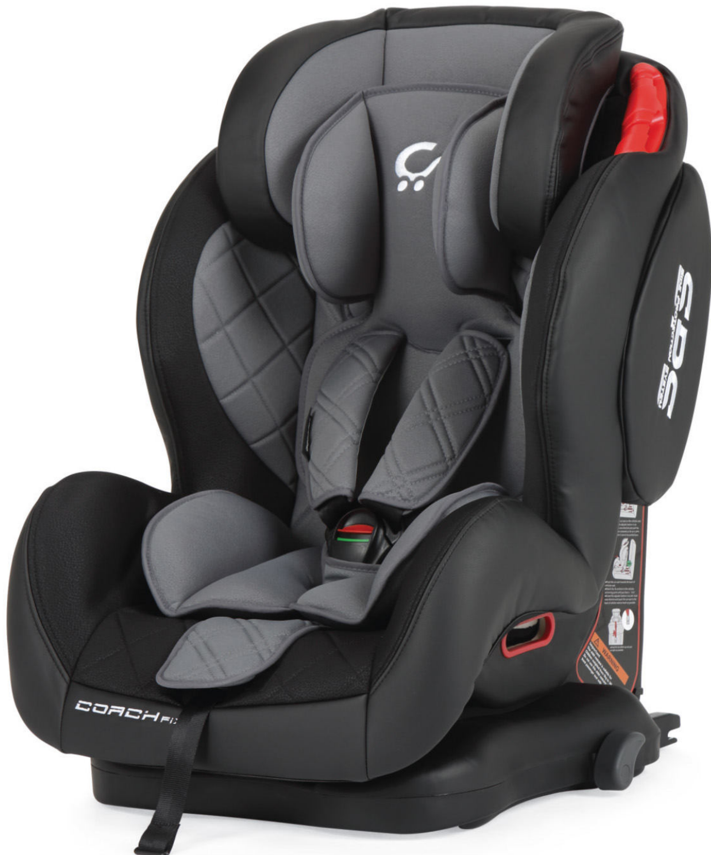
Negro - Gris | Preto - Cinza

Disponibile en Negro (PRX) | Negro - Gris (CZX) | Negro - Rojo (VRX) Disponível em Preto (PRX) | Preto - Cinza (CZX) | Preto - Vermelho (VRX)