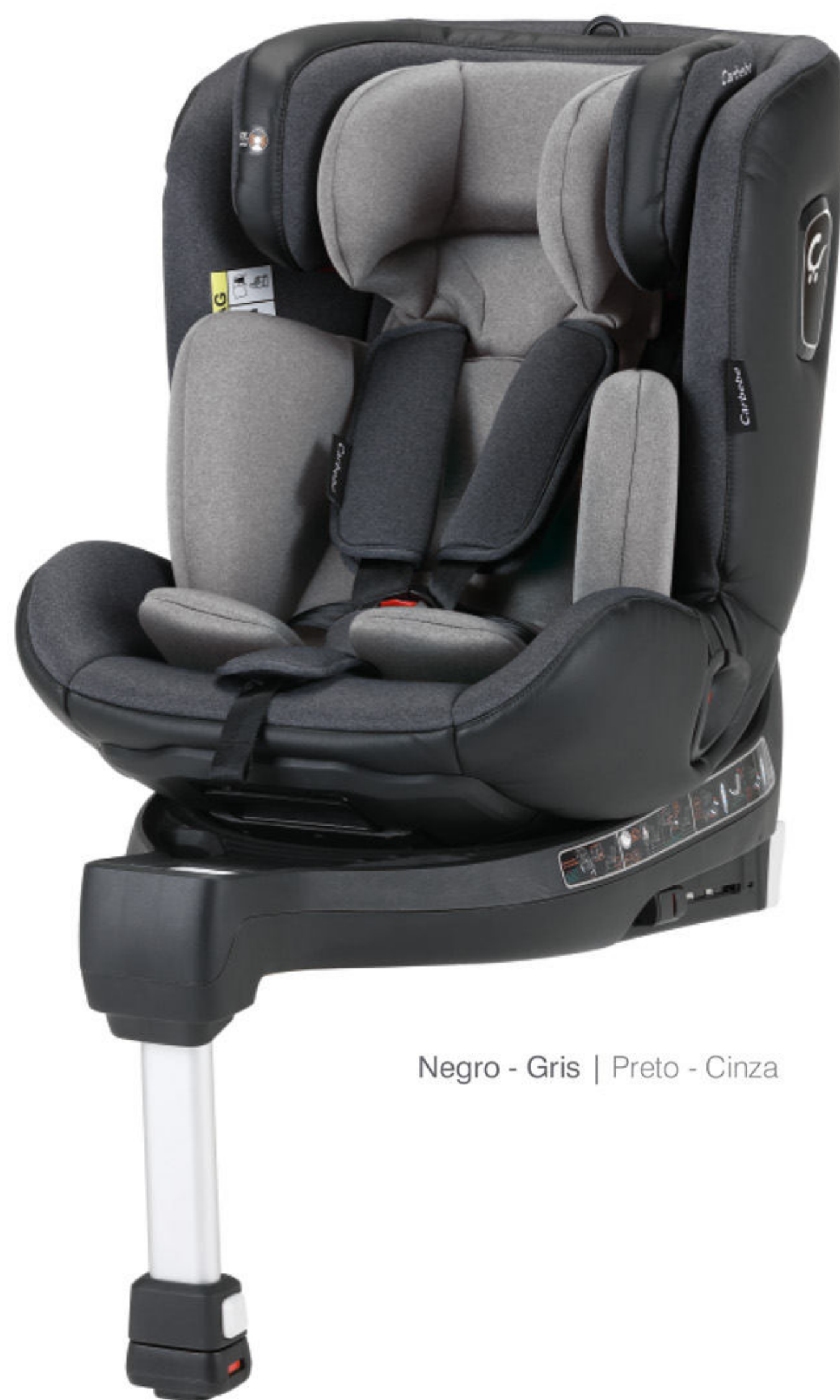
Negro - Gris | Preto - Cinza