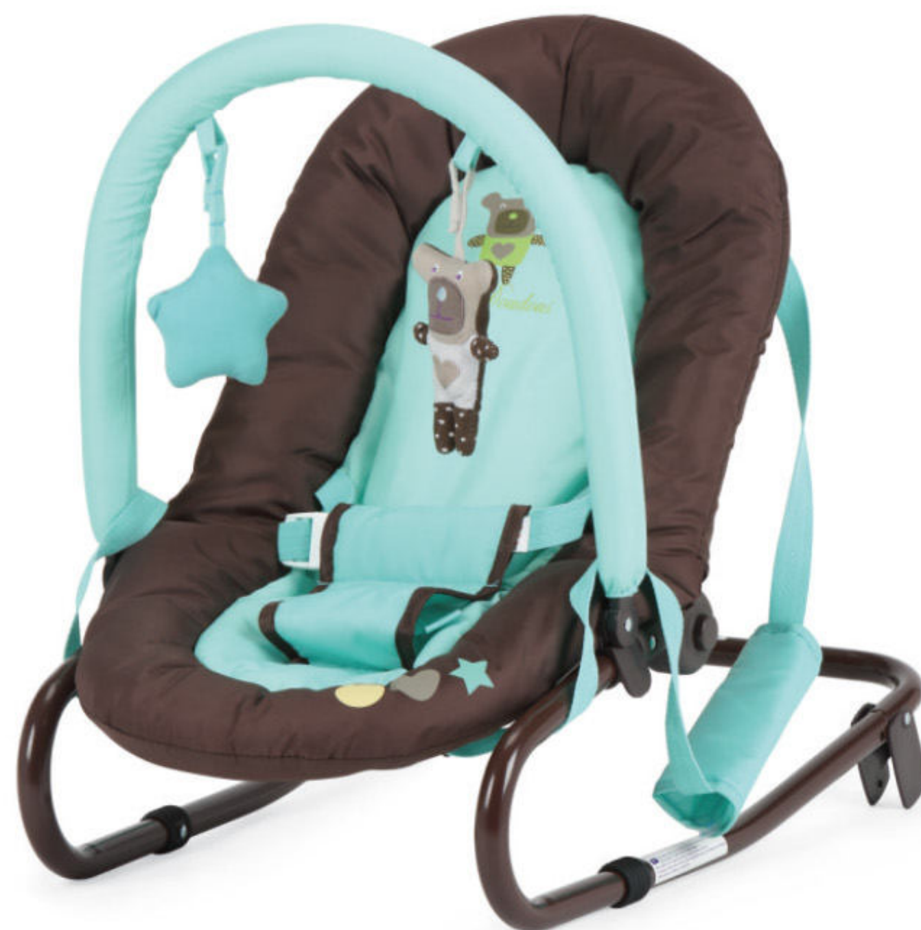
MES DOUDOUS - (B3W)