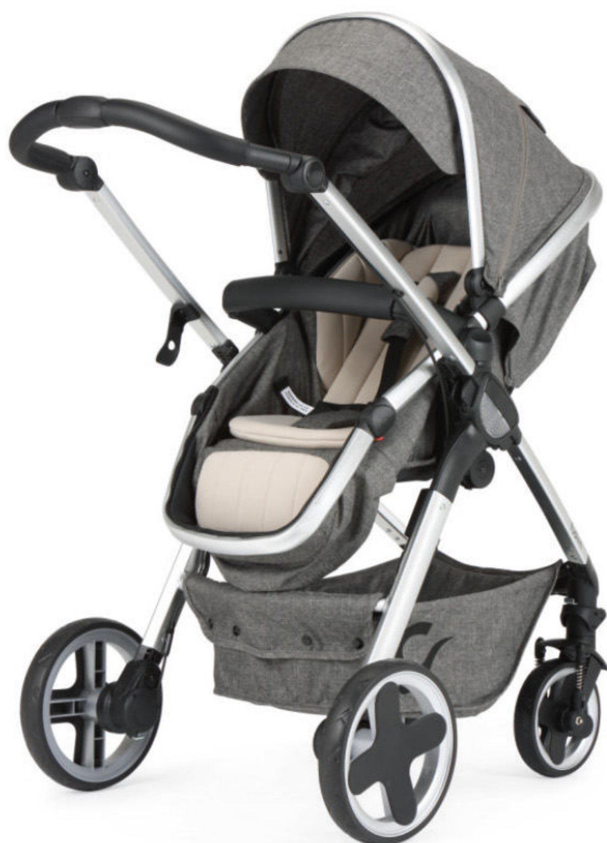
Representado en version hamaca en color Gris Representado em versão assento na cor Cinza