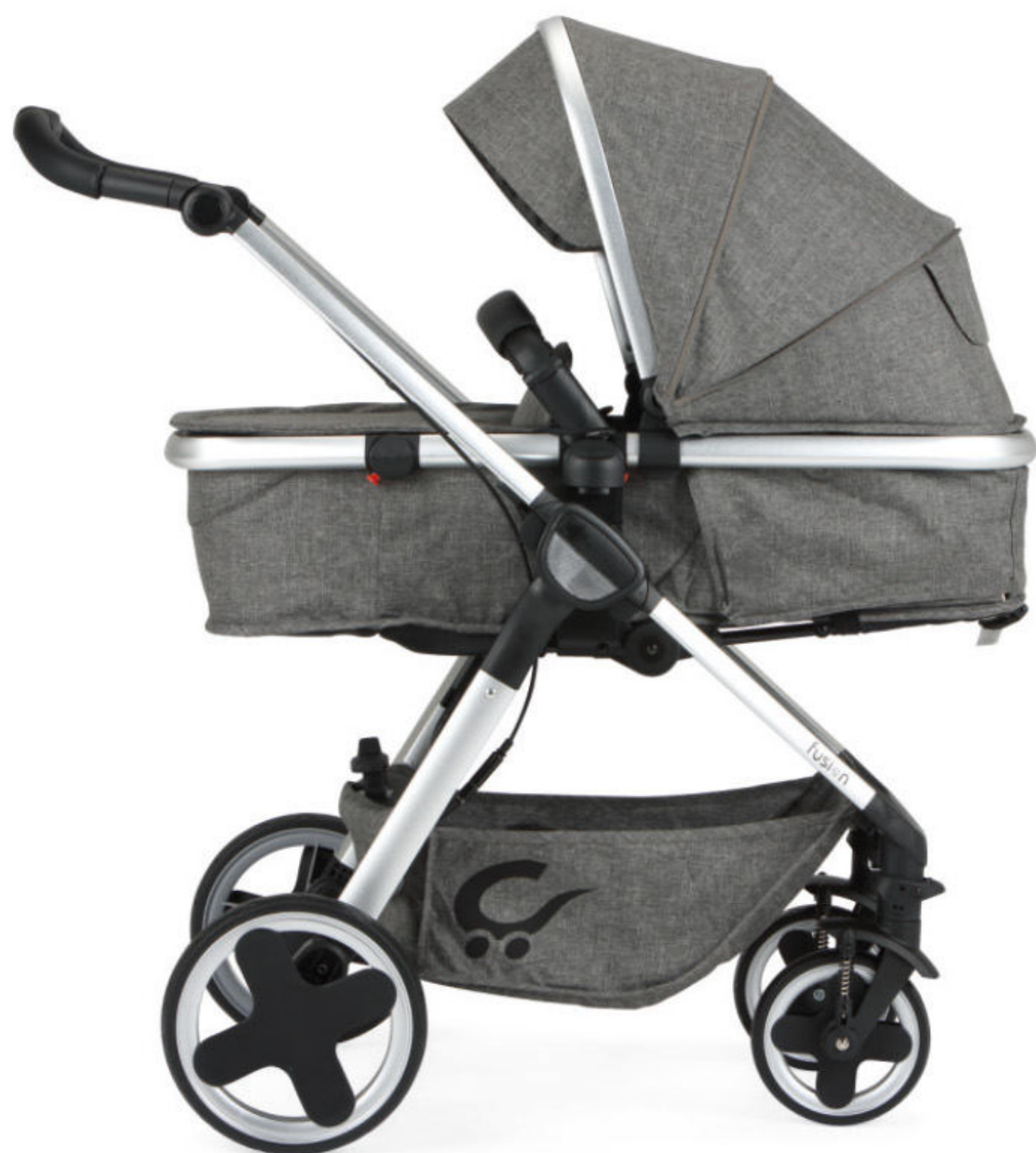
Representado en version capazo en color Gris Representado em versão alcofa na cor Cinza