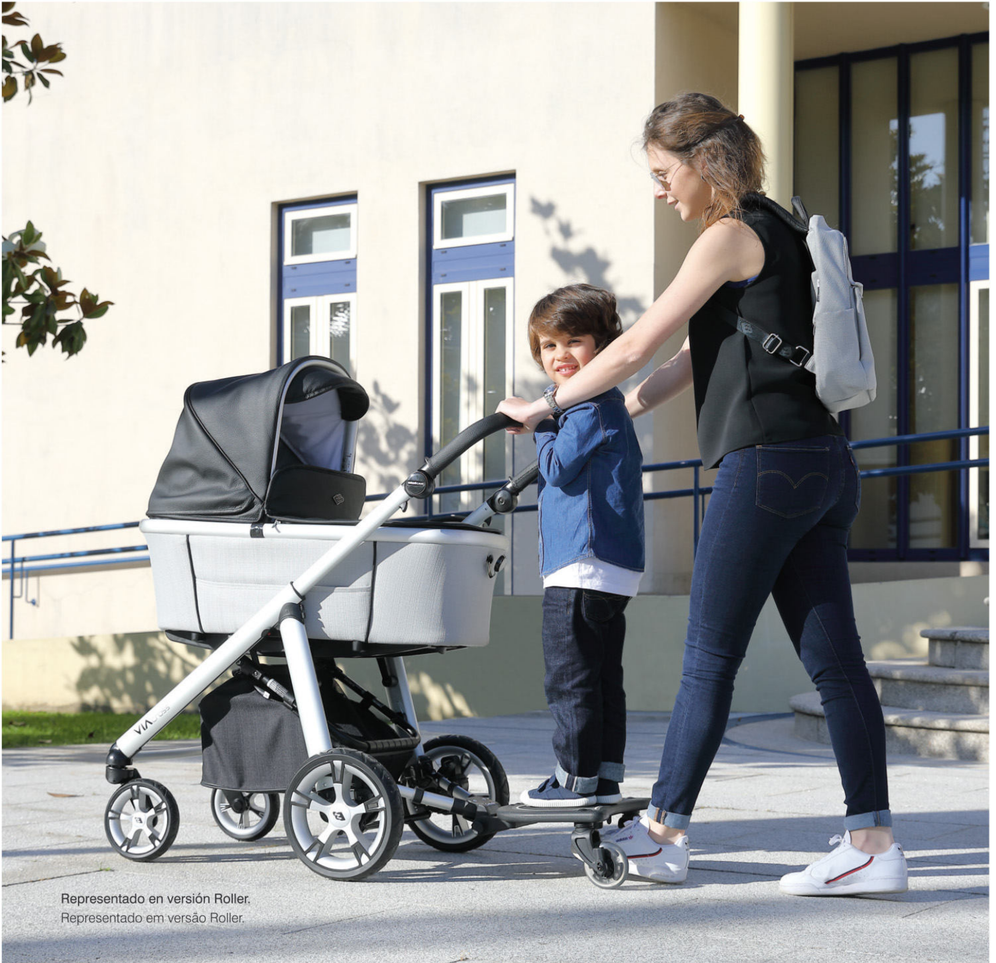
Representado en versión Roller. Representado em versão Roller.

El Roller destaca por su practicidad al poderse enganchar a prácticamente todos los cochecitos, sillas de paseo y sillas ligeras del mercado.