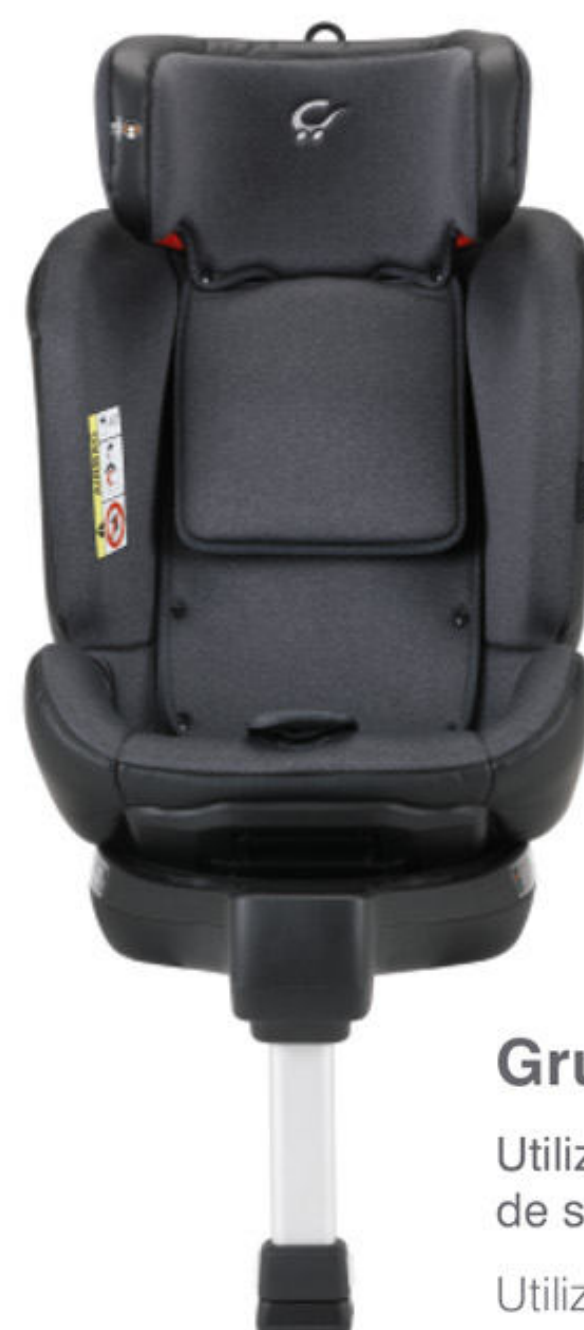
Grupo 2, 3

Reposacabezas regulable en altura. Cabeceiro regulado de altura.