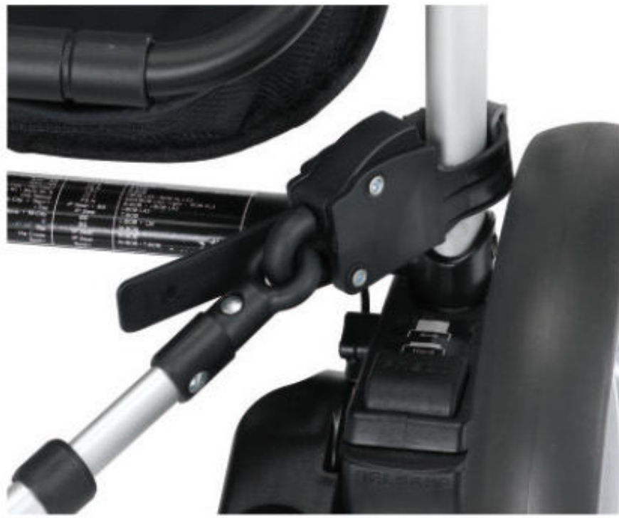
Sistema de fijación rápido y fácil. Sistema de fixação rápido e fácil.