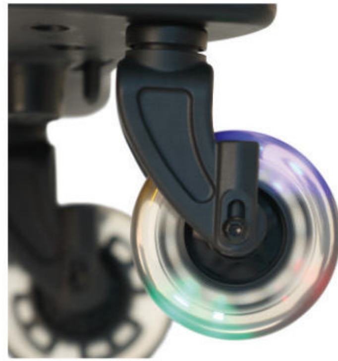
Ruedas duraderas de PU con luces intermitentes. Rodas em PU durável com luzes intermitentes.