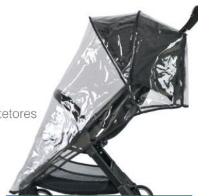
Cobertura de lluvia Cobertura de chuva