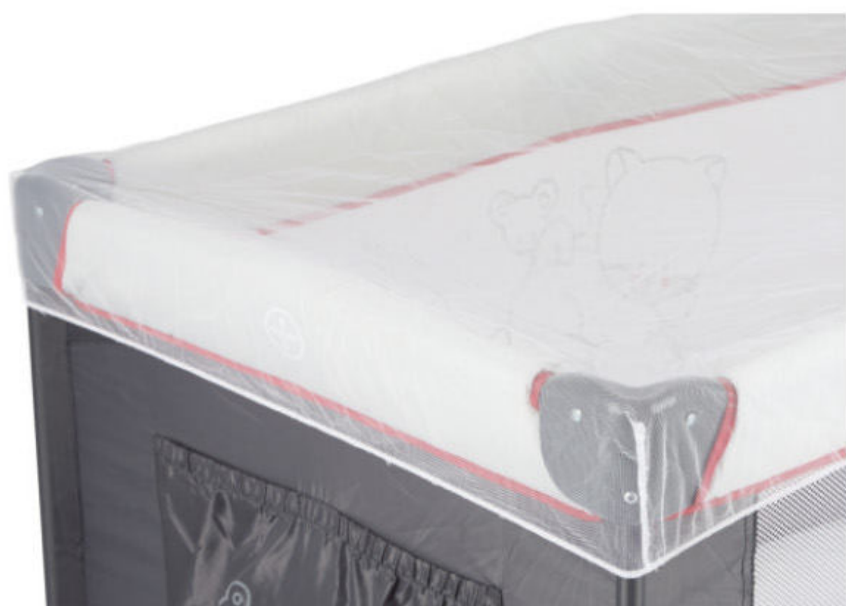
Rede mosquiteira Mosquitera