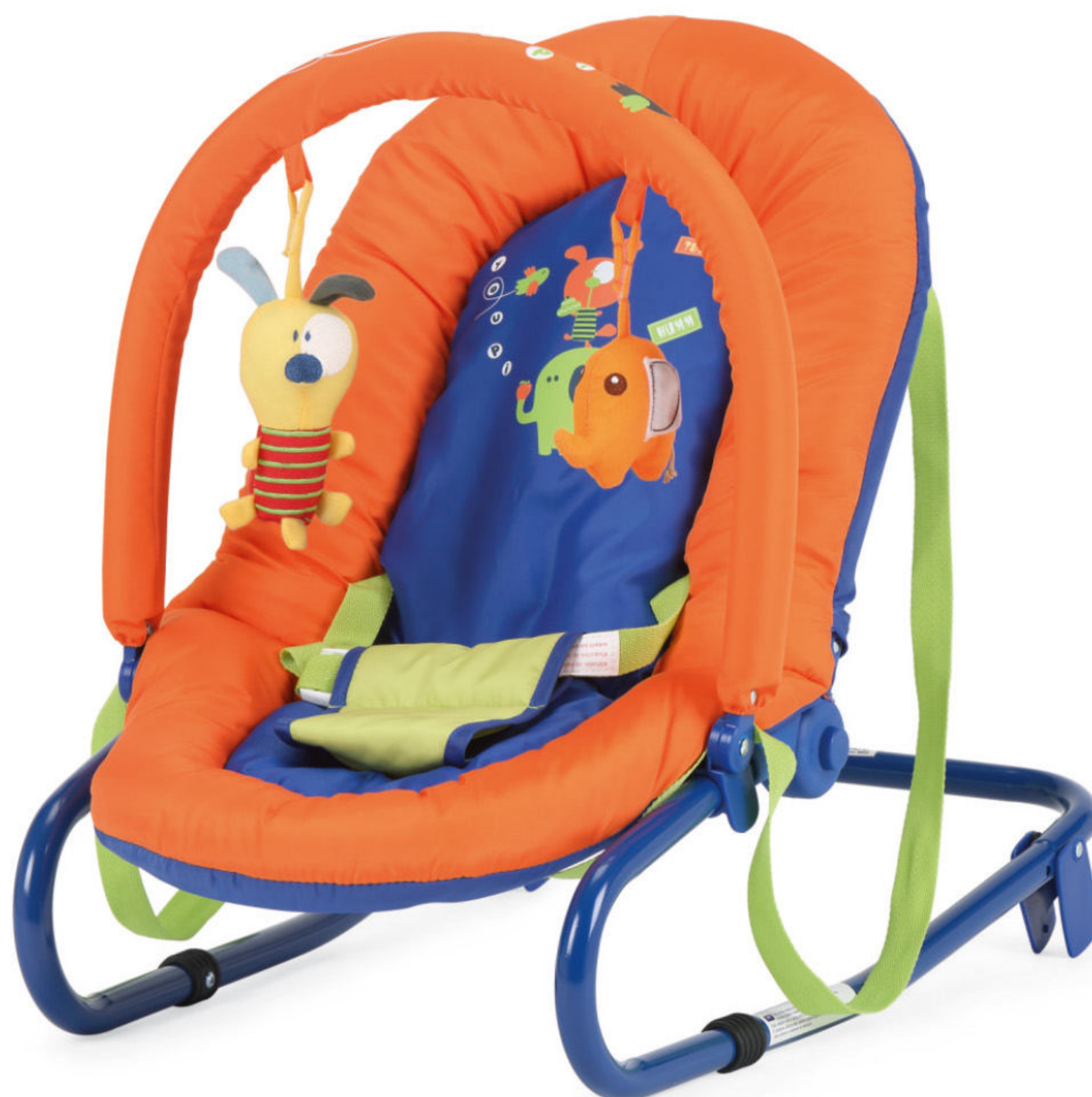
TOUTOU - (B3V)

Disponível em Azul - Laranja (B3V) | Castanho - Verde (B3W) | Cinza - Vermelho (B3X) Disponible en Azul - Naranja (B3V) | Marrón - Verde (B3W) | Gris - Rojo (B3X)