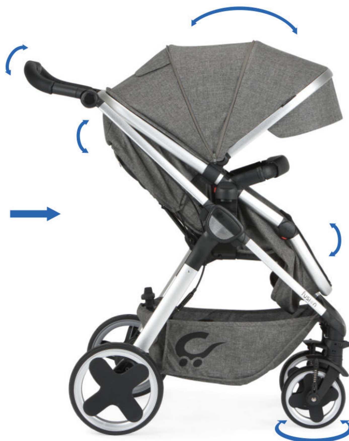
Representado en version hamaca en color Gris Representado em versão assento na cor Cinza