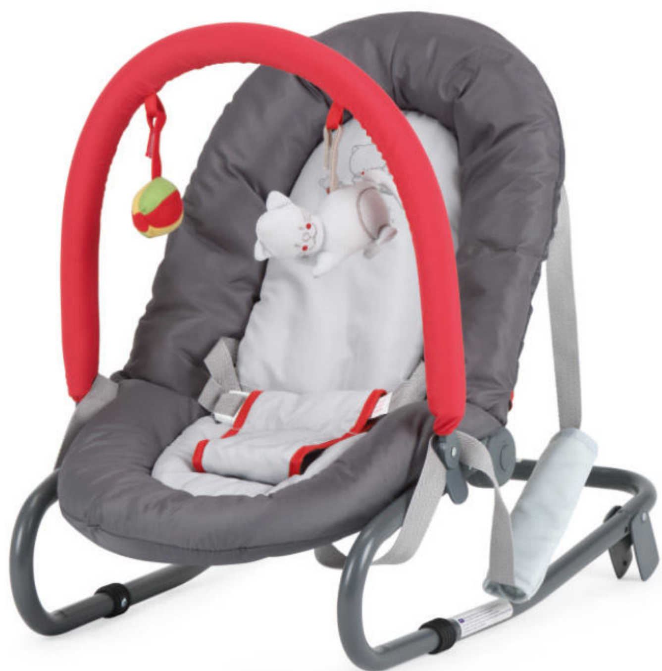
LES COPAINS - (B3X)