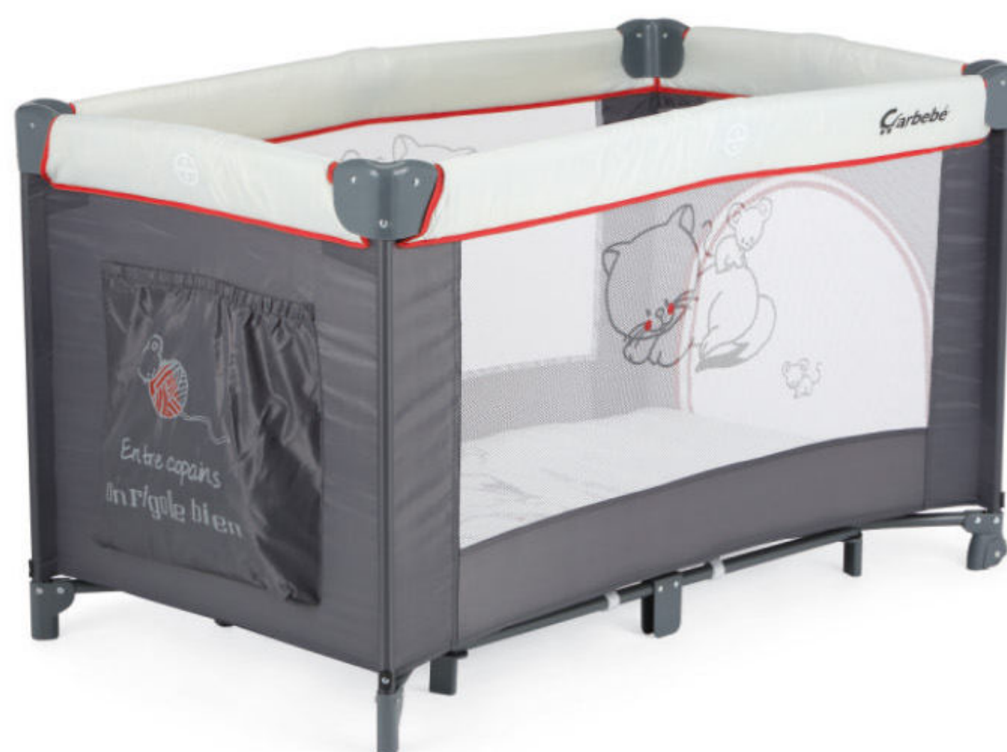
MES DOUDOUS - (P6X)