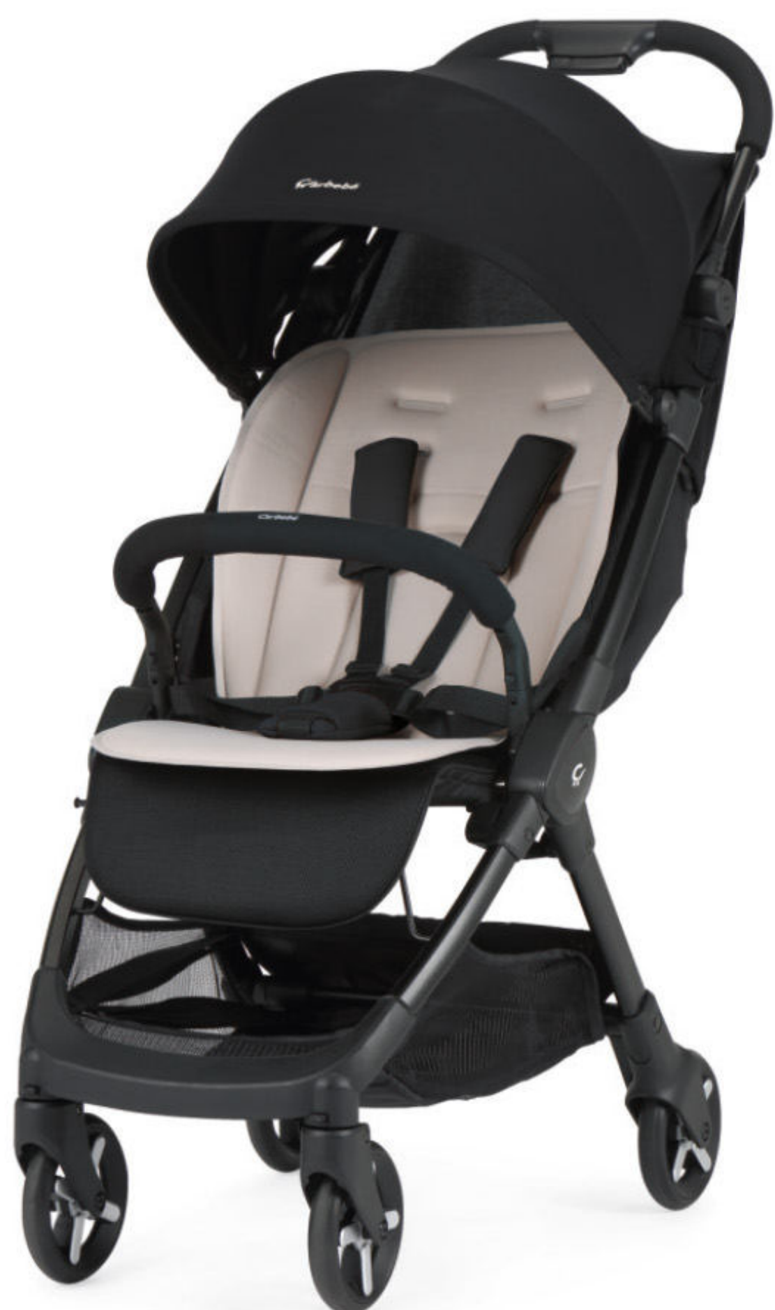
Negro | Preto