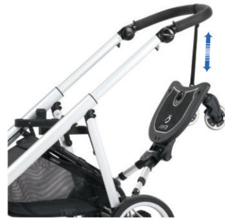
Correa ajustable para cuando no esté en uso. Correia regulável para quando não está a ser usado.