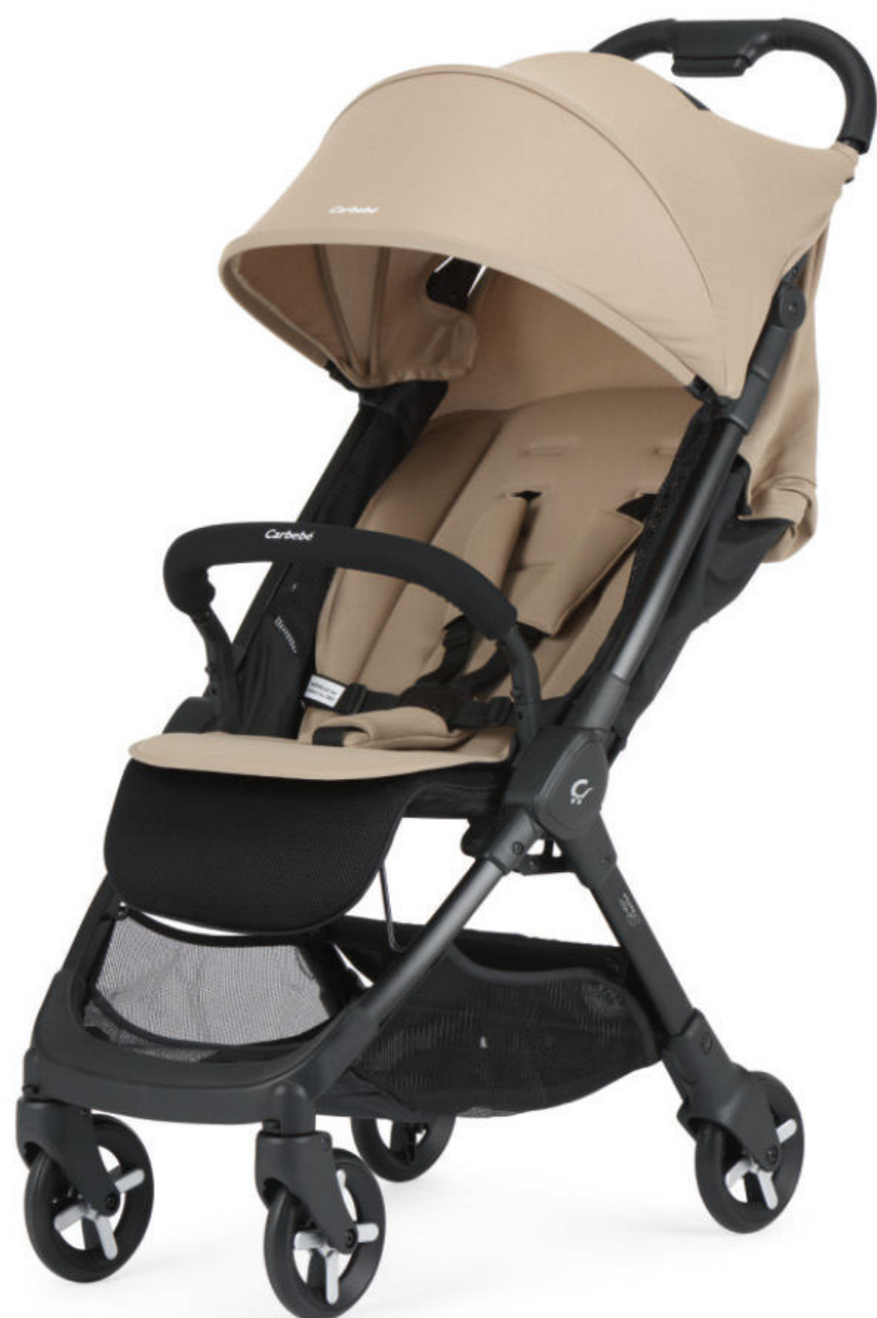
Beige | Bege