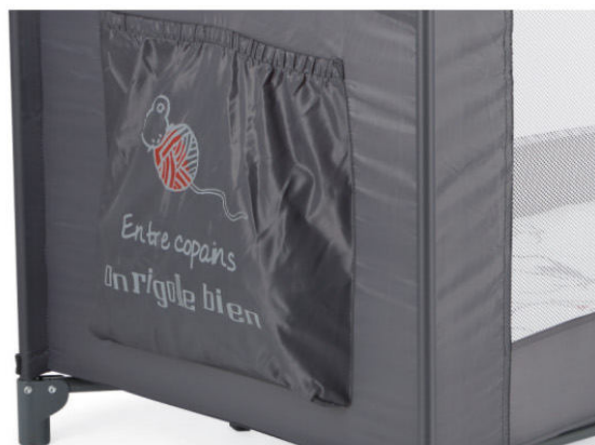
Bolso para guardar pequenos objectos Bolsillo para guardar pequeños objetos