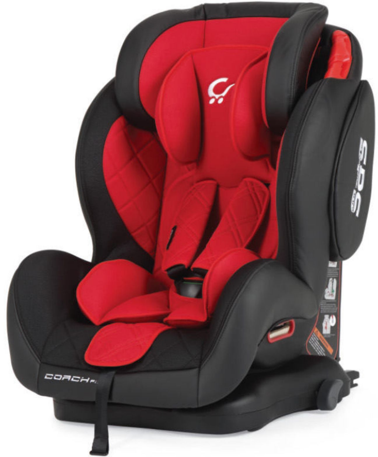
Negro - Rojo | Preto - Vermelho