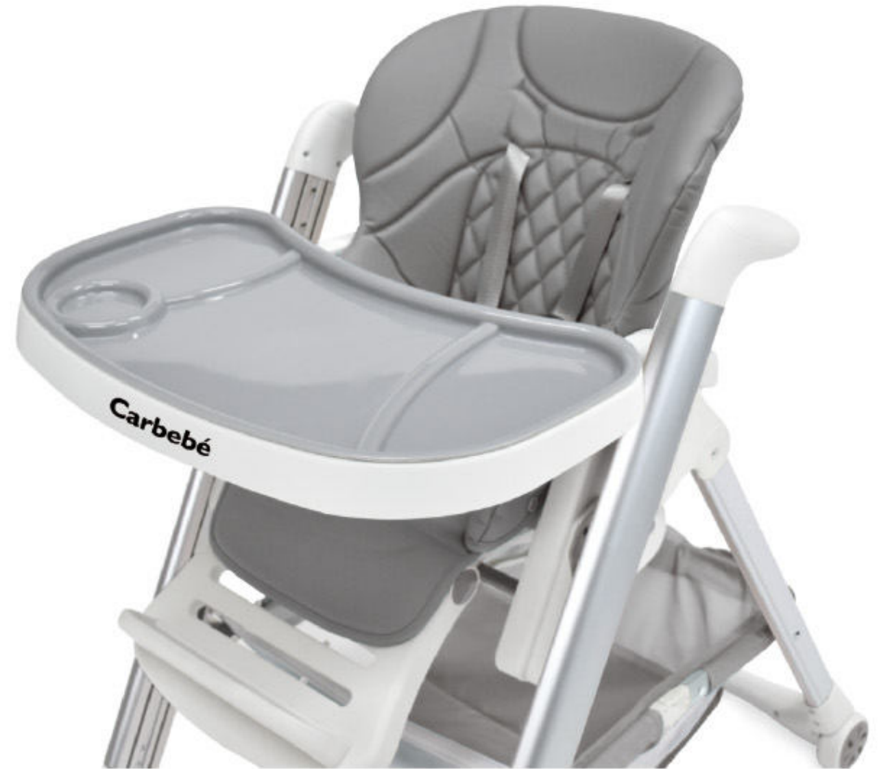
Gris con estructura anodizada | Cinza con estrutura anodizada