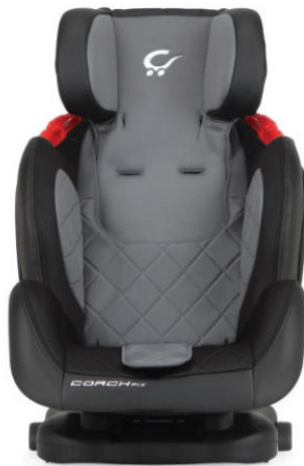
Grupo 2, 3