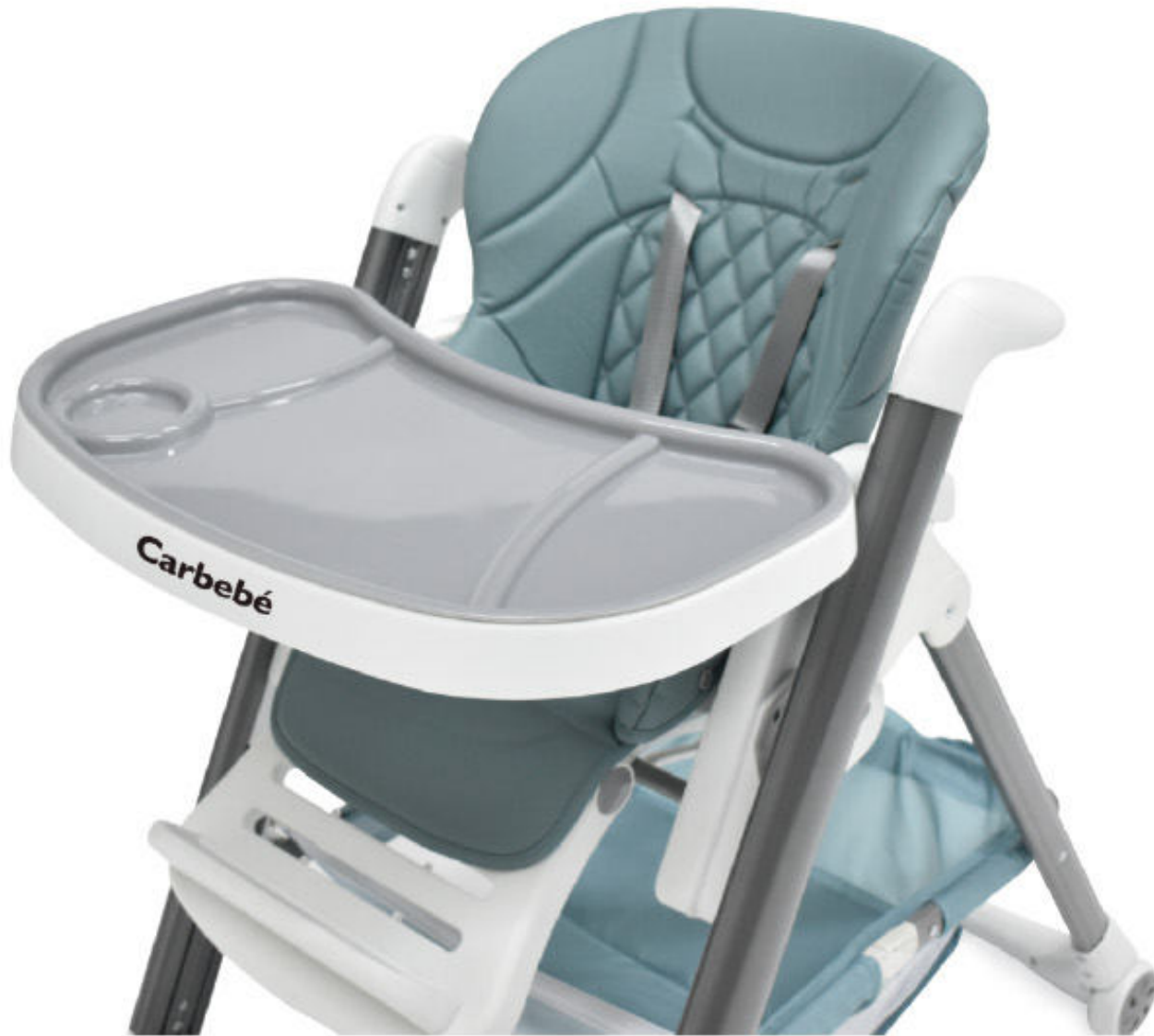
Azul con estructura gris | Azul con estrutura cinza