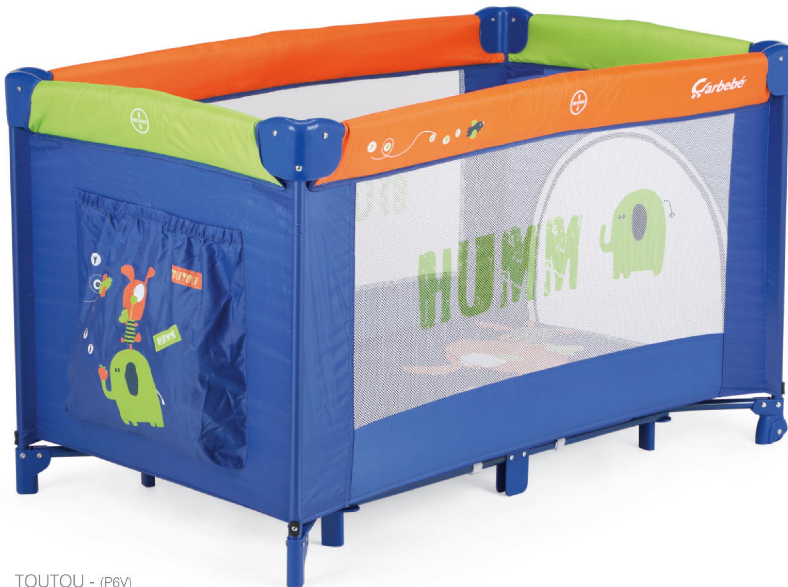
TOUTOU - (P6V)

Disponível em Azul - Laranja (P6V) | Castanho - Verde (P6W) | Cinza - Vermelho (P6X) Disponible en Azul - Naranja (P6V) | Marrón - Verde (P6W) | Gris - Rojo (P6X)