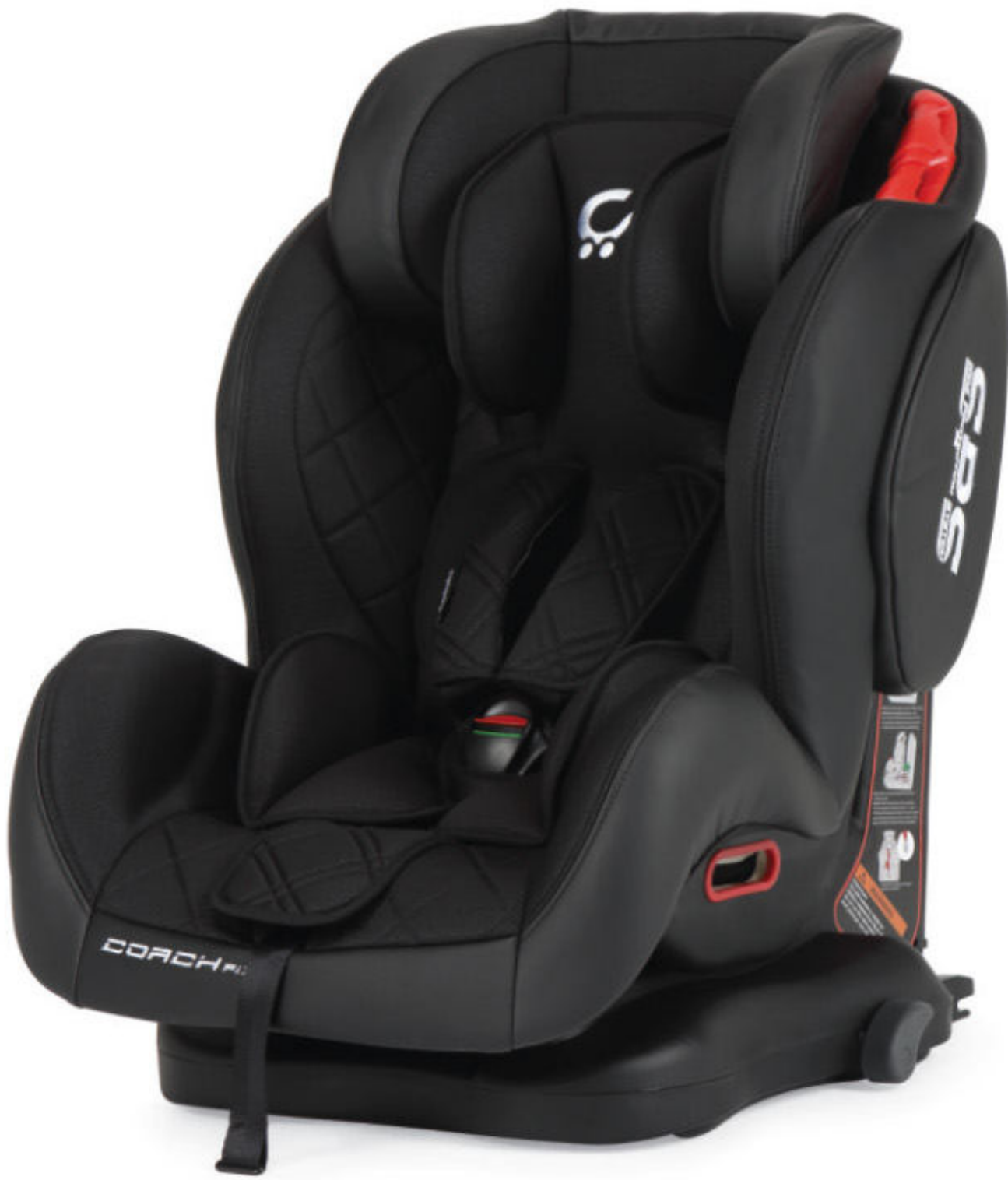
Negro | Preto