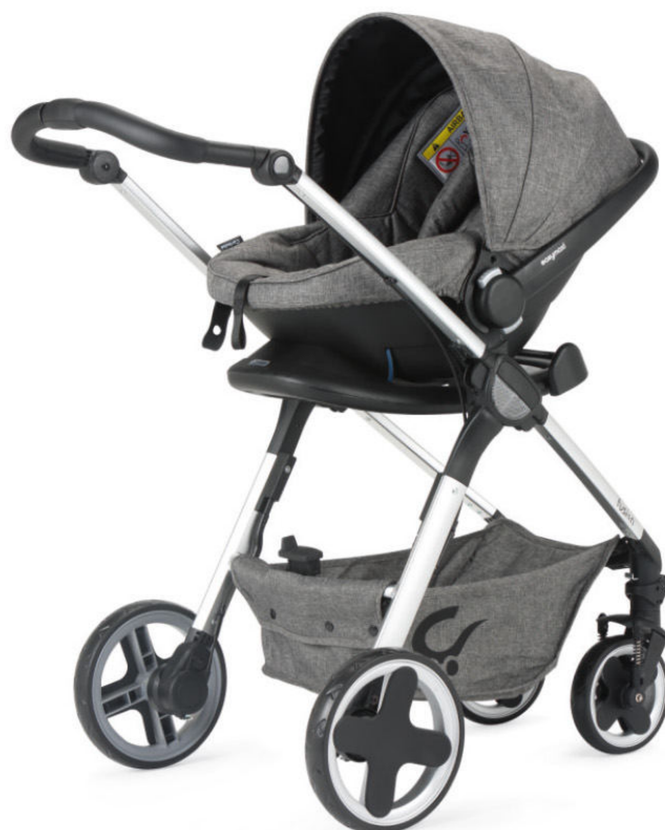
Representado con silla de Grupo 0+ opcional en color Gris Representado com assento auto Grupo 0+ opcional na cor Cinza